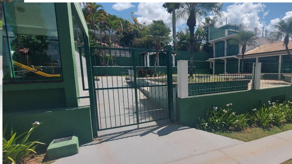
ACESSO SECUNDÁRIO DO SALÃO DE FESTAS – TIPO RAMPA