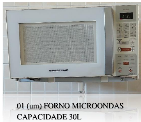
01 (um) FORNO MICROONDAS CAPACIDADE 30L