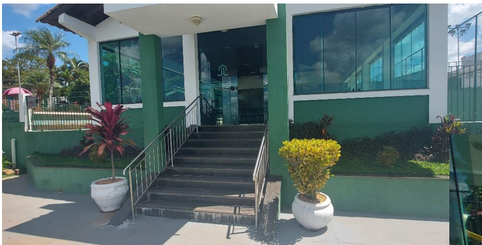
ENTRADA PRINCIPAL DO SALÃO DE FESTAS - ESCADA