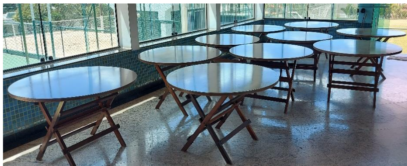
10 (dez) MESAS DE MADEIRA MED. 1,35cm (circunferência) Altura: 0,80cm