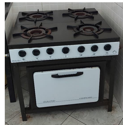
01 (um) FOGÃO INDUSTRIAL C/ 04 BOCAS E 01 (um) FORNO