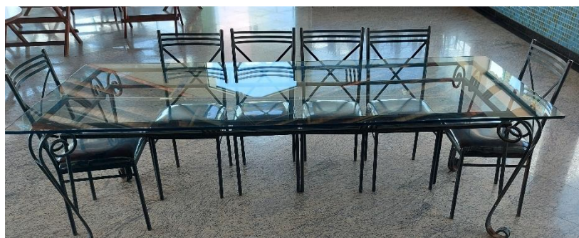
01 (uma) MESA DE BUFFET EM VIDRO TEMPERADO 10mm - MED. L2,50xC0,80xA0,80