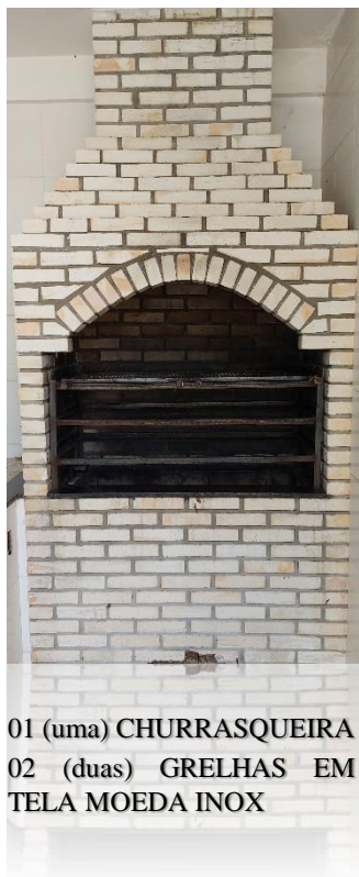
01 (uma) CHURRASQUEIRA 02 (duas) GRELHAS EM TELA MOEDA INOX