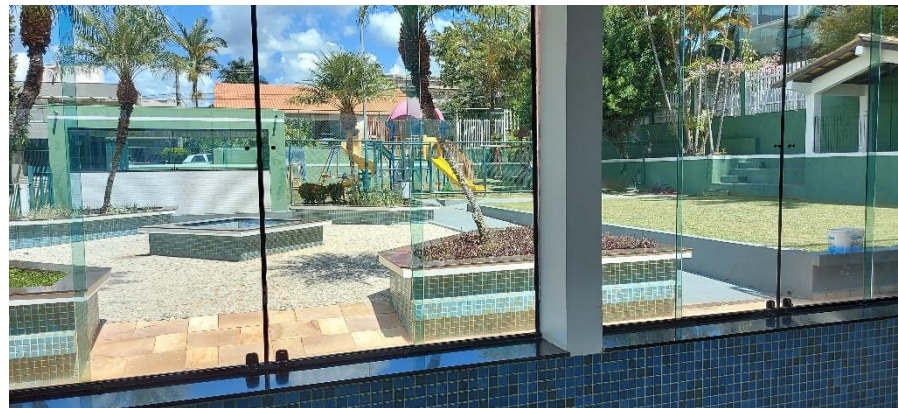
ÁREA EXTERNA DO SALÃO QUE DÁ ACESSO AO PAQUINHO INFANTIL.

OBS: A ÁREA DO PARQUINHO INFANTIL, NÃO FAZ PARTE DA LOCAÇÃO DO SALÃO DE FESTAS.