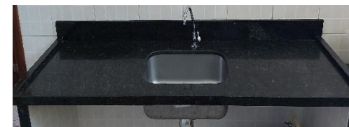
A COZINHA POSSUI 02 (duas) PIAS C/ TORNEIRAS BICA MÓVEL