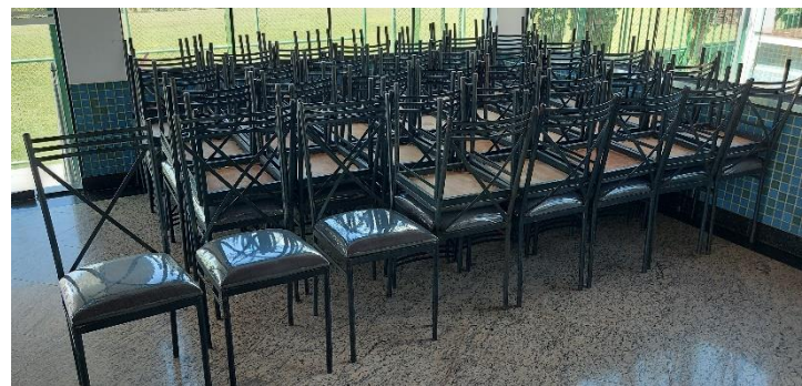
80 (oitenta) CADEIRAS ESTOFADAS EM TECIDO E VINIL EM ESTRUTURA (BASE) DE FERRO