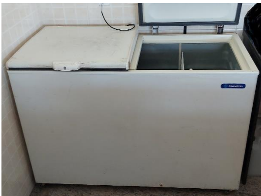
01 (um) FREEZER CAPACIDADE 419L