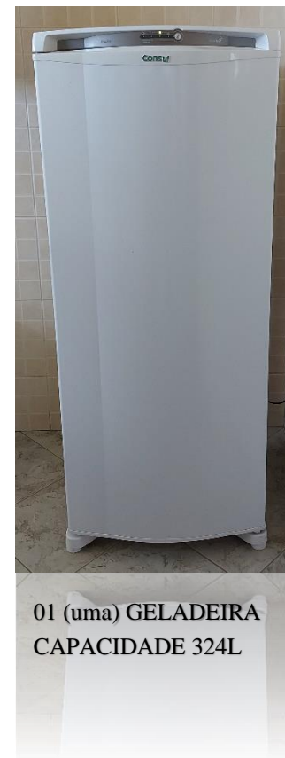
01 (uma) GELADEIRA CAPACIDADE 324L