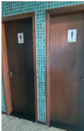
DENTRO DO SALÃO DE FESTAS EXISTEM – WC FEMININO E MASCULINO