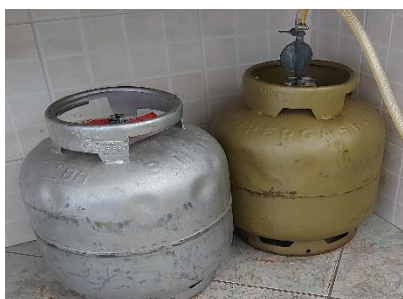
02 (dois) BOTIJÕES DE GÁS - 13Kg