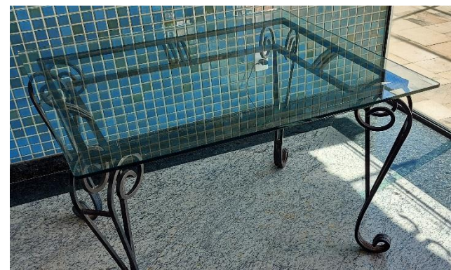
01 (uma) MESA DE BUFFET EM VIDRO TEMPERADO 10mm - MED. L1,00xC1,10xA0,80