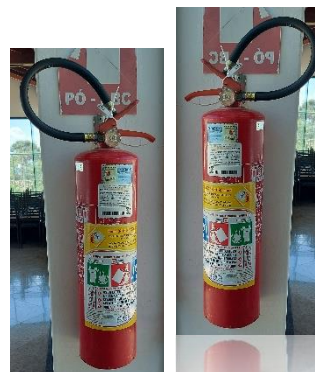
O SALÃO POSSUI 02 (dois) EXTINTORES DE INCÊNDIO - COM CARGA ABC