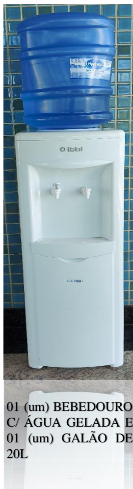
01 (um) BEBEDOURO C/ ÁGUA GELADA E 01 (um) GALÃO DE 20L